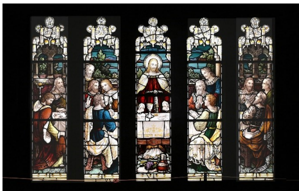
Fig.2 The Last Supper , by Alan Ballantine & Gardiner, ca. 1901, 218h × 49.0w x 5 cm, The Stained Glass Museum, Otaru.