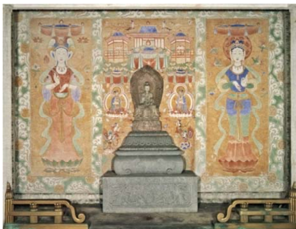
Fresco in the Sutokubuyo, the Charnel of the Owari-Tokugawa Family, 1938 In addition to the Suryaprabha and Candraprabha (Solar and lunar deities) painted on the left and right hand sides, angels are arranged in the middle to celebrate the stone Buddha figure placed in the front..