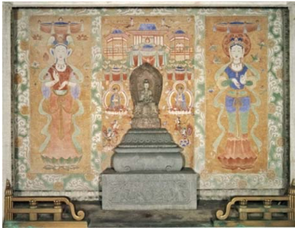
定光寺尾張徳川家納骨堂「崇徳廟」フレスコ壁畫, 1938。左右に日光菩薩と月光菩薩が, 中央には手前に置かれた石佛を祝福するやうに天女が描かれてゐる。